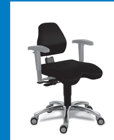
COMFORT MOVE™ OFFICE MEDICAL 4