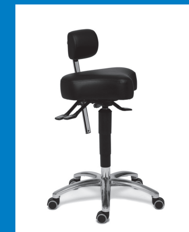
ERGO SOLEX™ DE LUXE