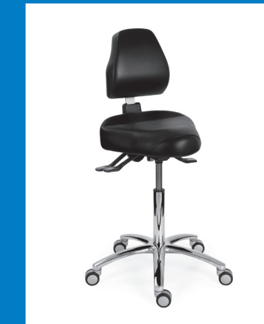
CORRECT SIT™ CM MEDICAL 3