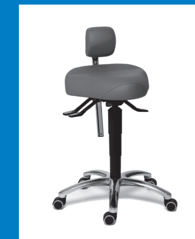
CORRECT SIT™ DE LUXE